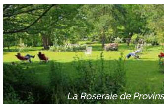
La Roseraie de Provins