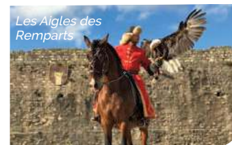
Les Aigles des Remparts