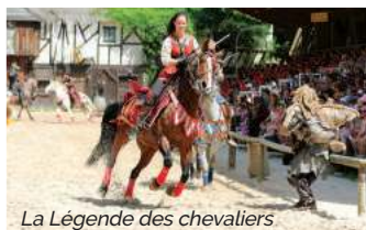
La Légende des chevaliers