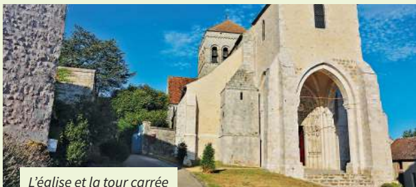
L'église et la tour carrée de saint-Loup-de-Naud

Le prieuré a été brûlé deux fois, en 1432 par les Anglais et en 1567 par les Protestants. Le monastère disparaît à la révolution. La tour carrée est le dernier vestige du prieuré fortifié, elle était la maison forte du Prieur. Successivement, elle a été la propriété de la famille de St-Phalle, la princesse de Polignac et son amante Violette Tréfusis écrivain britannique ; elle y tiendra un salon littéraire de 1945 à 1966. Marcel Proust y inventa le personnage du marquis de St-Loup pour son roman « A la recherche du temps perdu » lors d'une visite. Cette bâtisse contient un très beau mobilier et une exceptionnelle collection de miroirs anciens.