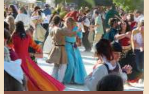
Les Médiévales de Provins