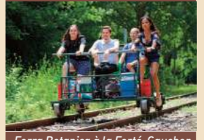
Ferra Botanica à la Ferté-Gaucher