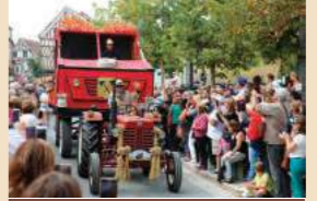
La Fête de la Moisson à Provins