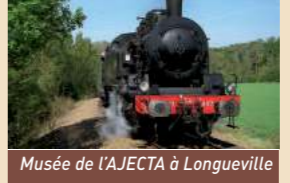
Musée de l'AJECTA à Longueville