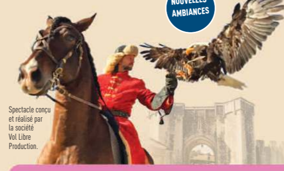
Spectacle conçu et réalisé par la société Vol Libre Production.

La Roseraie de Provins Présentation en avant-première des dernières créations de roses. Avec une vue imprenable sur les monuments, découvrez ce jardin calme et enchanteur dédié aux roses parfumées. L'histoire de cette fleur emblématique, ses couleurs, ses formes et ses parfums vous seront contés dans une atmosphère bucolique. Vous saurez tout des roses anciennes : gallicas (rose de Provins), roses de Damas, Albas, Centifolias, hybrides de thé, et des roses modernes qui fleurissent jusqu'à l'automne. Le jardin de "Simples" permettra de présenter différentes plantes médiévales aux vertus médicinales : aneth, angélique, consoude... Salon de thé, dégustation de produits à la rose, boutique, vente de rosiers, salle d'exposition, concerts et ambiance cosy à la chaleur du feu de cheminée dès les premiers frimas.