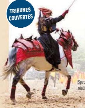
Spectacle conçu et réalisé par Equestrio.

PROGRAMMATION DU SPECTACLE : • Du 30 mars au 5 juillet : les week-ends et jours fériés à 15h45 ; en semaine 14h30. • Les 15 et 16 juin : Les Médiévales de Provins : le samedi à 14h, 16h et 18h ; le dimanche à 13h, 15h et 17h. • Du 6 juillet au 30 août : les week-ends et jours fériés à 15h45 ; en semaine à 15h. • Les 6 juillet et 3 août : spectacle nocturne « Crins de Feu » (prouesses équestres et cascades à la lueur des bougies) : à 21h30 et 23h. • Du 31 août au 29 septembre : les week-ends à 15h45 ; en semaine à 14h30. • Du 30 septembre au 3 novembre : les week-ends et jours fériés à 15h45. TARIFS : adulte 12,50 € - enfant 8 € (4 à 12 ans) → Tarifs réduits avec les Pass : adulte 11 €/enfant 6,50 € (4 à 12 ans). → Tarifs « Crins de Feu » : adulte 8 € - enfant 4 € (4 à 12 ans). → Autres tarifs préférentiels, forfaits spectacles, enfants, étudiants, PMR, familles nombreuses, se renseigner auprès de l'organisateur. ■ Ouverture des portes 30 mn avant le début du spectacle. ■ Durée du spectacle : 45 mn.