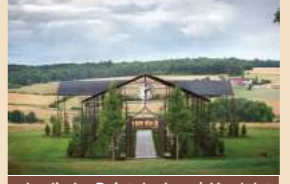
Jardin Le Point du Jour à Verdolot