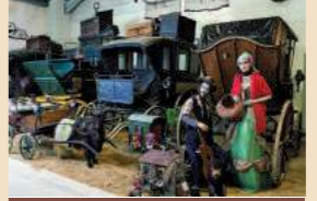
Le Musée de la Vie d'Autrefois aux Ormes-sur-Voulzie