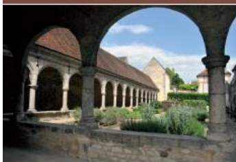
Le cloître de Donnemarie-Dontilly