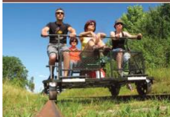
Ferra Botanica à la Ferté-Gaucher