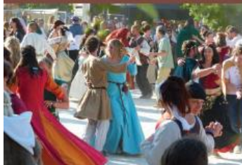
Les Médiévales de Provins