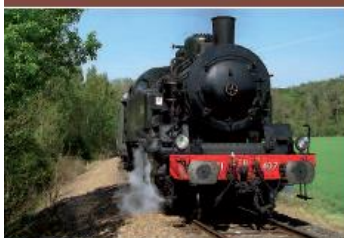
Musée de l'AJECTA à Longueville