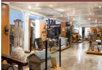
Le musée de Saint-Cyr-sur-Morin