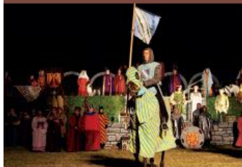
Le Son et Lumière de Provins