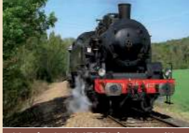
Musée de l'AJECTA à Longeville