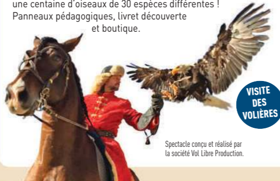
Spectacle conçu et réalisé par la société Vol Libre Production.

Vous serez fasciné par le vol des aigles, buses, faucons, milans, caracaras, vautours, chouettes, hiboux et serpentinaire, en totale complicité avec chevaux, loups et dromadaire. Un ballet aérien inoubliable ! Depuis 2010, la Fauconnerie est inscrite au patrimoine culturel immatériel de l'UNESCO. À l'issue du spectacle, visite d'une des plus belles voleries de France abritant une centaine d'oiseaux de 30 espèces différentes ! Panneaux pédagogiques, livret découverte et boutique.