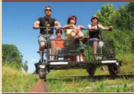
Ferra Botanica à la Ferté-Gaucher