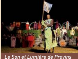
Le Son et Lumière de Provins