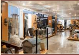
Le musée de Saint-Cyr-sur-Morin