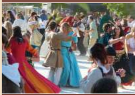
Les Médiévales de Provins