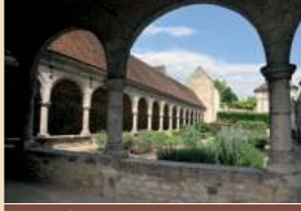
Le cloître de Donnemarie-Dontilly