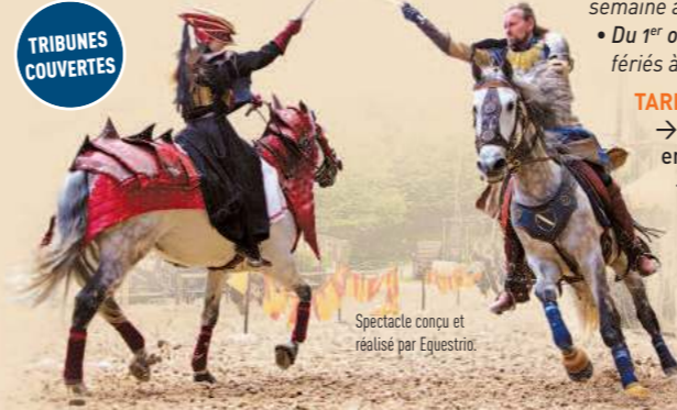
Spectacle conçu et réalisé par Equestrio.

Une aventure épique à partager en famille ou entre amis ! Rythmée par le galop de magnifiques chevaux ibériques, cette plongée au XIII e s. mêlera humour, action, magie et art équestre. Panneaux pédagogiques sur les machines de guerre et l'héraldique. Boutique.